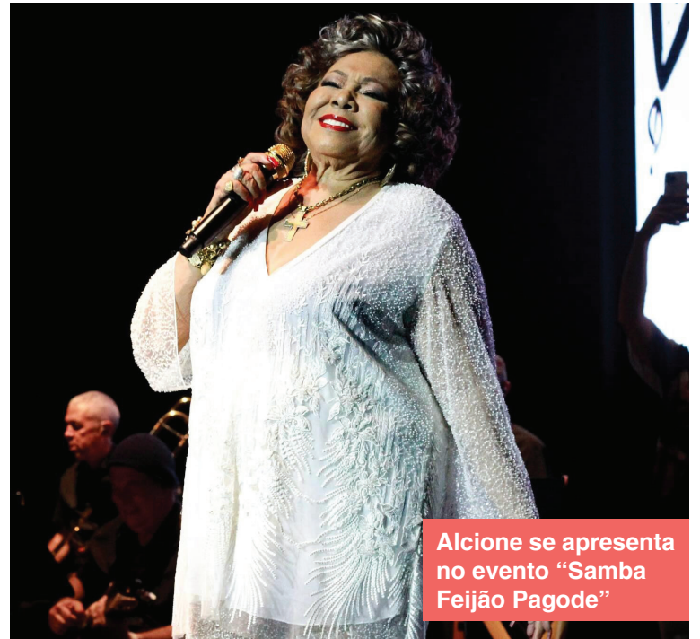
Alcione se apresenta no evento “Samba Feijão Pagode”

Seja pelo preço mais acessível, pelo consumo consciente ou mesmo pela busca por peças únicas, a moda circular já é uma realidade na vida de muitos consumidores. Por isso, o Container Village tem promovido essas feiras, que chega à 5ª edição, se tornando um espaço de refe-